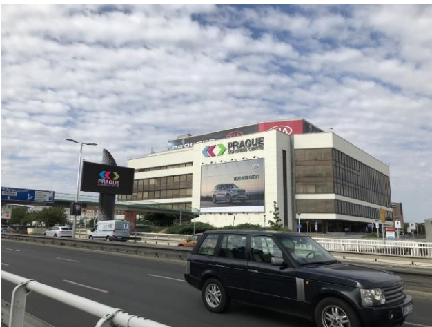
学会会場 (Prague Congress Centre)

「博士・修士課程学生のための国際研究集会渡航助成」の支援を受け、2019 年 7 月 3 日から 7 月 6 日にチェコのプラハで開催された 24th Annual Congress of the ECSS に参加した。本学会は、年に 1 度行われるスポーツ科学に関する研究分野全般を対象とした国際的な学術集会であり、様々な分野の研究者が世界中から集う。各研究はトピックごとに分類されており、関連分野をはじめとした多くの研究者が発表を聞きに訪れていた。筆者は最終日に「racquet sport」というセッションにて、「Simulation of the trajectory of shuttlecock in badminton」というタイトルでポスター発表を行った。本研究は、バドミントンにおいて、相手コートに最短時間で到達する軌道やその特徴について検討したものである。発表時には多くの方から質問を頂き、またポスター発表終了後にも、興味を持っていただいた研究者から質問やアドバイスを頂いた。本学会参加を通して世界中の沢山の研究者の方々と意見交換をして自身の研究の知見を深めることができ、非常に貴重な経験となった。このような機会を与えていただいたこの度の助成に感謝するとともに、本学会にて得られた経験を今後の研究活動に活かしていきたい。